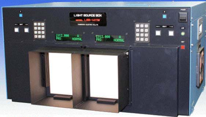
※Option 3차트가이드 부착상태